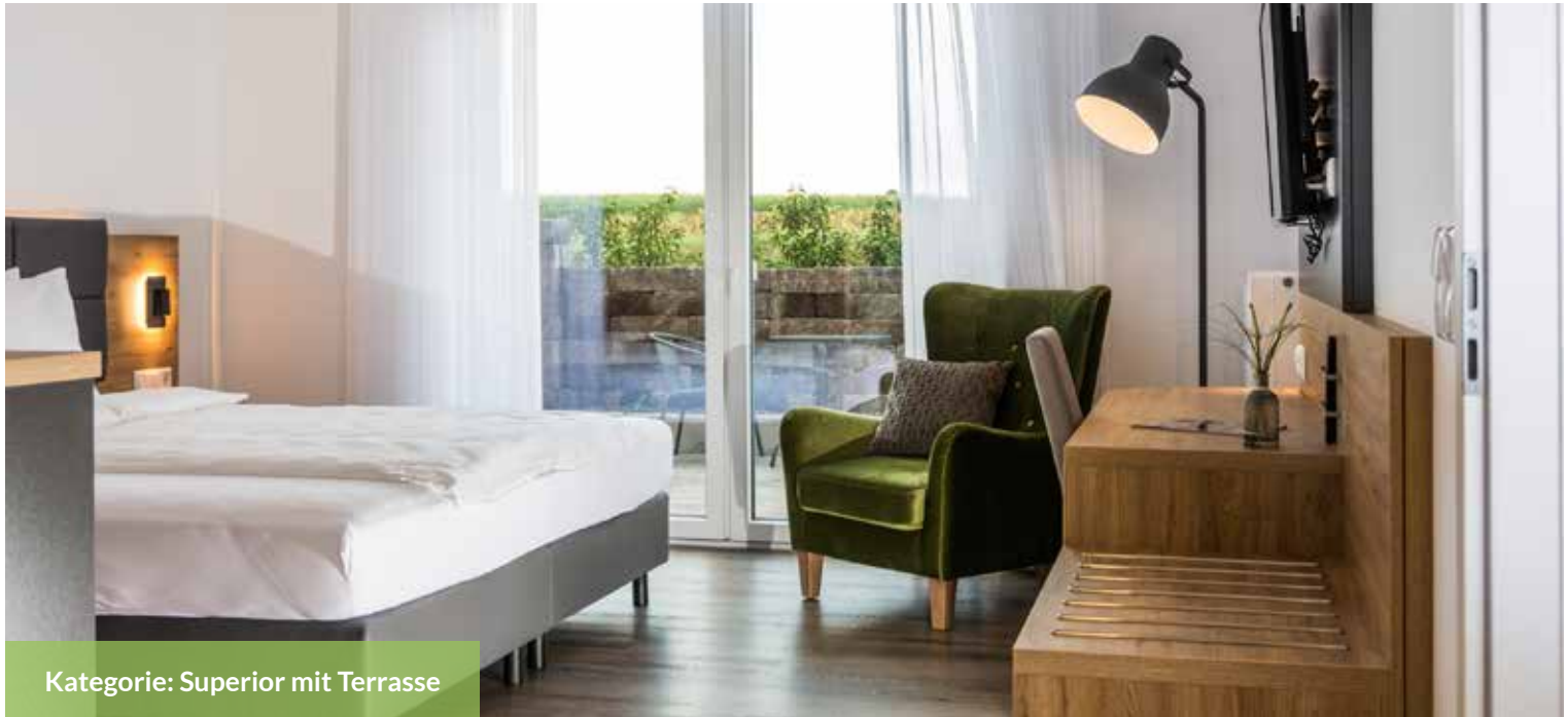
Kategorie: Superior mit Terrasse